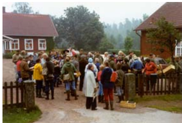
Deltagarna samlas inför dagens exkursion.