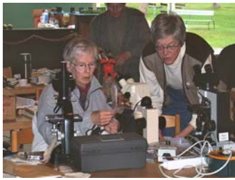
Grebbestad 2004, gelésvampskurs

Dessa 30 år har innehållit över 40 svampträffar och mykologiveckor, över 20 veckoslutskurser och svampdagar och 4 resor utanför Sverige. Reportage från dessa presenteras fortlöpande i SMF: s tidskrift, först Medlemsblad, sedan Jordstjärnan och SMT, Svensk Mykologisk Tidskrift. ( Länk SMT )