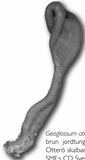
Geoglossum atropurpureum (purpurbrun jordtunga), Bohuslän, Tanum, Otterö skalbank, 2001-10-20. SMF:s CD Svenska svampar, 2002:1.