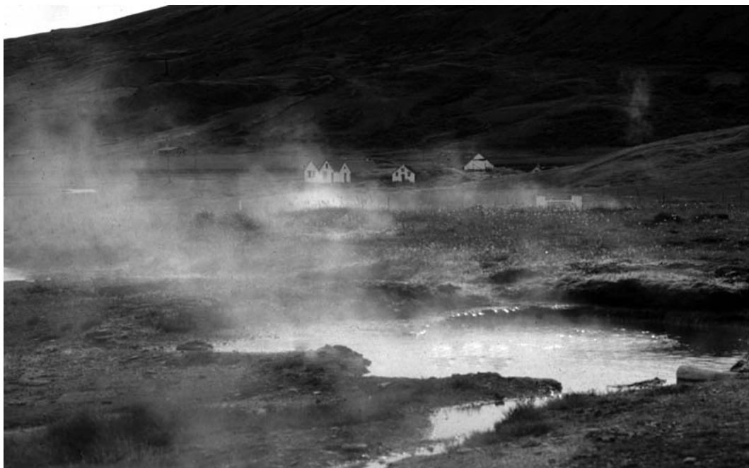
Haukadalur; Island. Kanske en exkursionslokal under SMF:s resa 2006. Läs mer på sid 7.