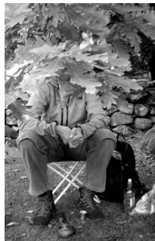
Fotograf okänd. Objekt okänt, eller...

Bilderna skall vara opublicerade. Bilderna får användas av SMF efter avslutad tävling. Medlemmar i styrelse och redaktion får inte delta.