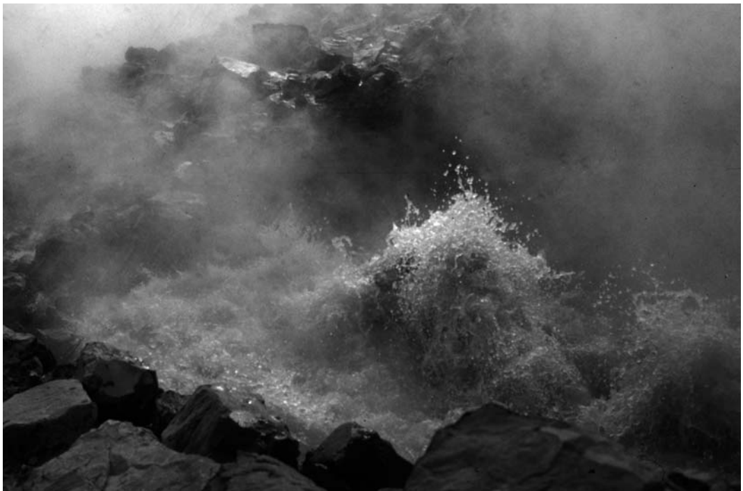
En svavelosande varm källa på sydvästra Island. Följ med SMF till Island. Läs mer på sidan 7.