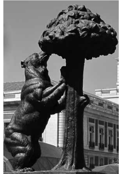
Madrid stadssymbol. Björnen äter inte svamp utan smaskar i sig frukter från jordgubbsträdet ( Arbutus unedo ).