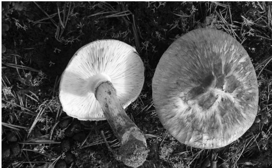
Fig. 1. Goliatmusseron ( Tricholoma matsutake). Norrbotten, Jokkmokk, Hällforsen, 2007-08-29.

skogsfru ( Epipogium aphyllum ) och flera arter rödlistade skivlingar. Lämnar man älvdalen har man möjlighet att se några av landets finaste urskogar, bl.a. Luottåive. Här är tillgången på granlågor mycket stor och den tickintresserade kan finna krävande arter som rosenticka ( Fomitopsis rosea ), lappticka ( Amylocystis lapponica ) och ostticka ( Skeletocutis odora ).