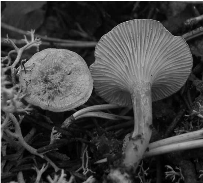
Fig. 2. Smultronkantarell ( Hygrophopsis olida). Norrbotten, Jokkmokk, Lyckan 2005-09-16.

I Jokkmokksskogarna finns många fornlämningar, främst i form av härdar och fångstgropar. Dessa påminner oss om att vi rör oss i ett mångtusenårigt kulturlandskap. Människan har följt renens årstidsbundna vandringar mellan fjäll och skog och gör så än idag. I augusti-september är flertalet renar kvar i fjällen, men enstaka skogsrenar kanske vi träffar på under exkursionerna. Den som vill veta mer om renskötseln i Jokkmokk kan gärna titta in på [www.sameportalen.se], där begrepp som sameby, fjäll- och skogsrenskötsel förklaras. När man besöker Jokkmokk bör man heller inte missa ett besök på Åtjte Svenskt Fjäll- och Samemuseum.