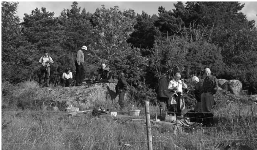
Fältlunch på Lammön. Studio Fungorum 2011.